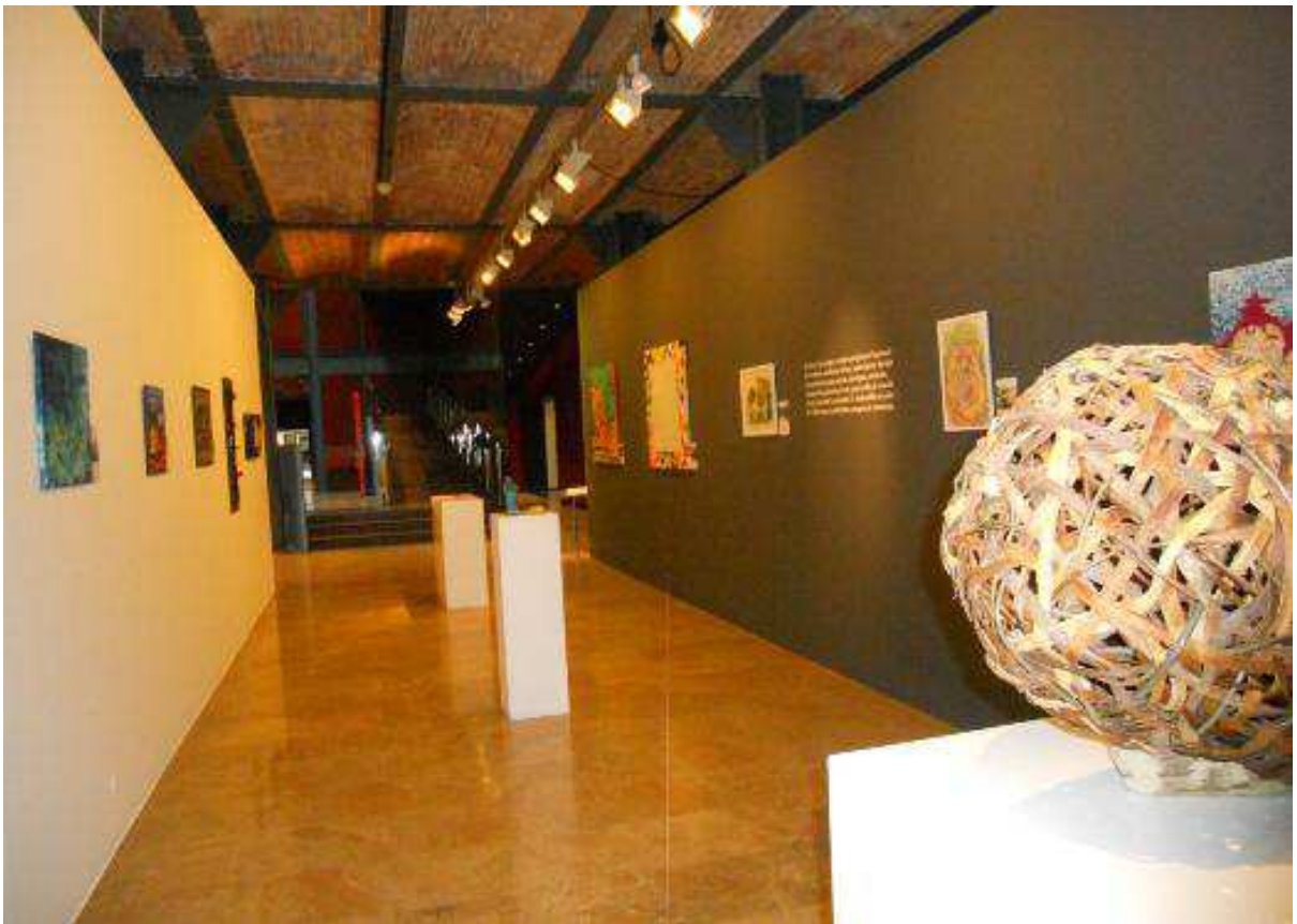
Dos perspectivas de la exposición