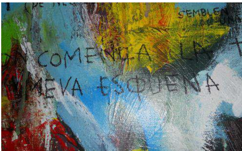
SENSE TÍTOL HIPERBÓREO Pintura acrílica i poesia, 100 x 100