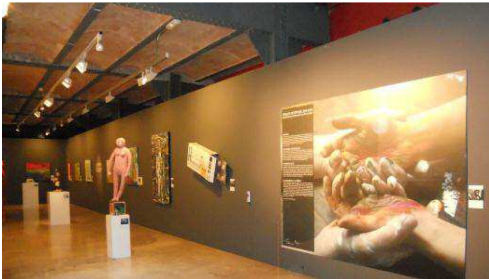
Entrada a la exposició en el Museu d'Història de Catalunya

La visita para mí resultó de un gran interés a nivel psicológico, artístico, grafológico y humanístico, son obras sumamente interesantes. Este trabajo no pretende analizar todas i cada una de las obras, ni desde la mirada artística ni psicografológica, es simplemente un breve recorrido, deteniéndonos en pequeñas observaciones como pueden ser firmas, escritos sobre la tela, algún que otro trazo del que hacemos una interpretación más psicografológica que estética.