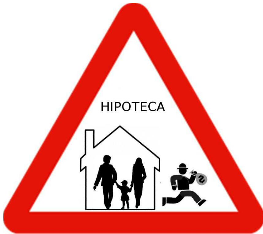
Javier Rivera , 3º de ESO