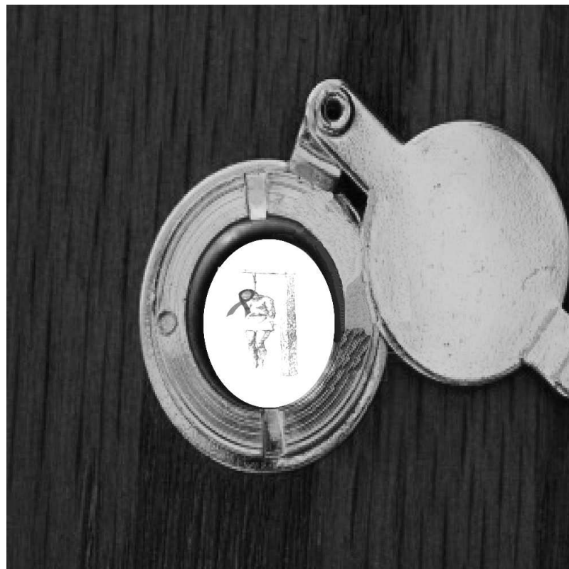
Javier Molinillo , 3º de ESO