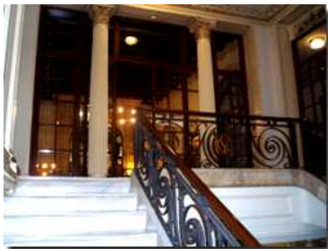
Entrada a la Biblioteca del Centre de lectura

La Biblioteca del Centre de Lectura de Reus va néixer, junt amb l'entitat, l'any 1859, amb el propòsit de posar a l'abast de tothom la cultura. Amb més o menys recursos al llarg de la seva història, la biblioteca ha estat i és una font de cultura per a la ciutat de Reus .