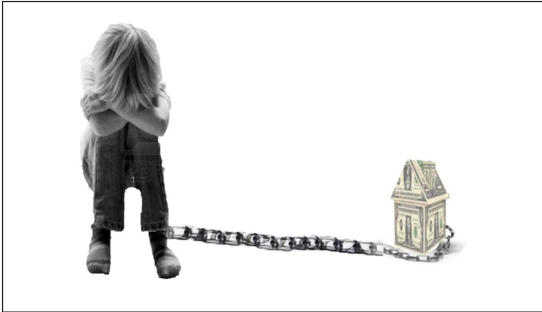
Javier Molinillo , 3º de ESO