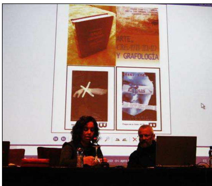
(Reportaje de César Reglero).

Con la conferencia-taller impartida en el Centre de Lecturas de Reus, basada en estos cuatro libros he querido establecer una relación entre diferentes disciplinas y, tomando como base la grafología, establecer la conexión que se puede generar con la poesía visual y el apropiacionismo, que son, en definitiva, los cuatro puntos cardinales donde tengo estructurado mi quehacer profesional en la actualidad.