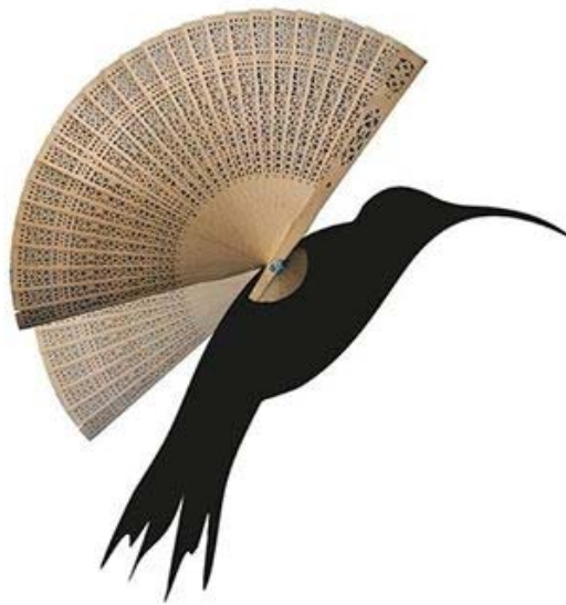
Poema Visual: Picaflor - Autor: AZ2013

Editorial: Arribat el desembre comença un temps de propòsits o de vegades de despropòsits. Tots ens proposem ser millors persones, començar a fer esport, deixar de fumar, no beure tant, passar més temps amb la família, ajudar a casa, etc. etc.