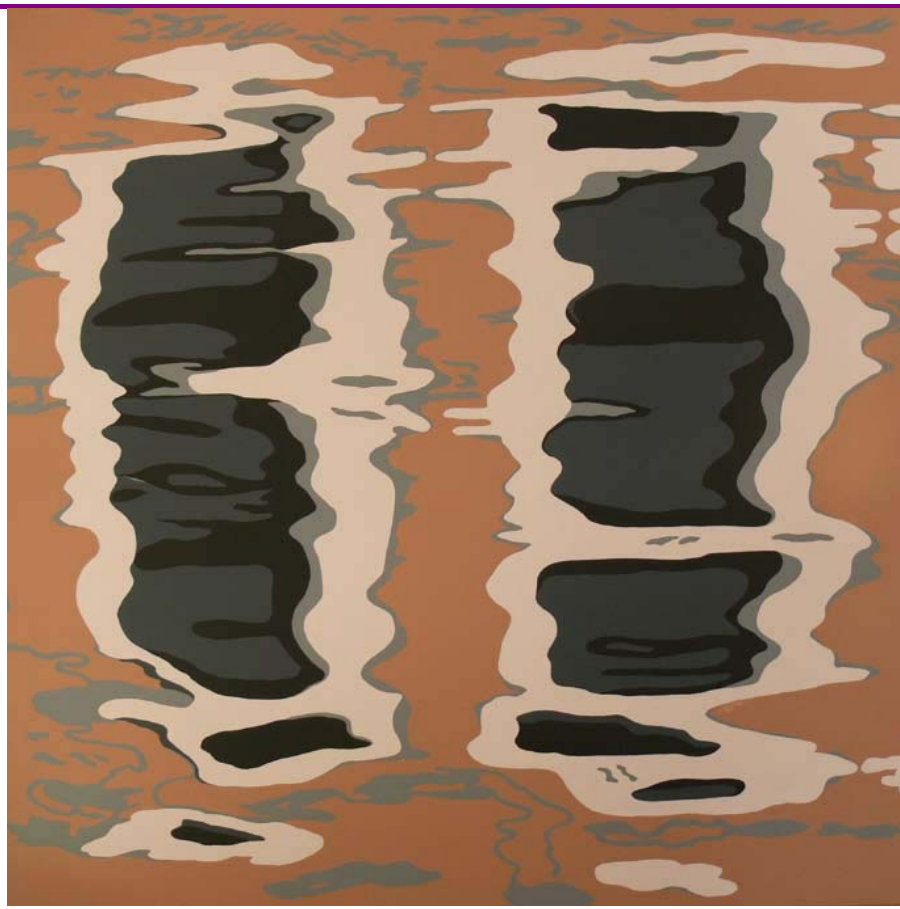
Abstracción líquida I Acrílico sobre lienzo 162 x 162 cm – 2010